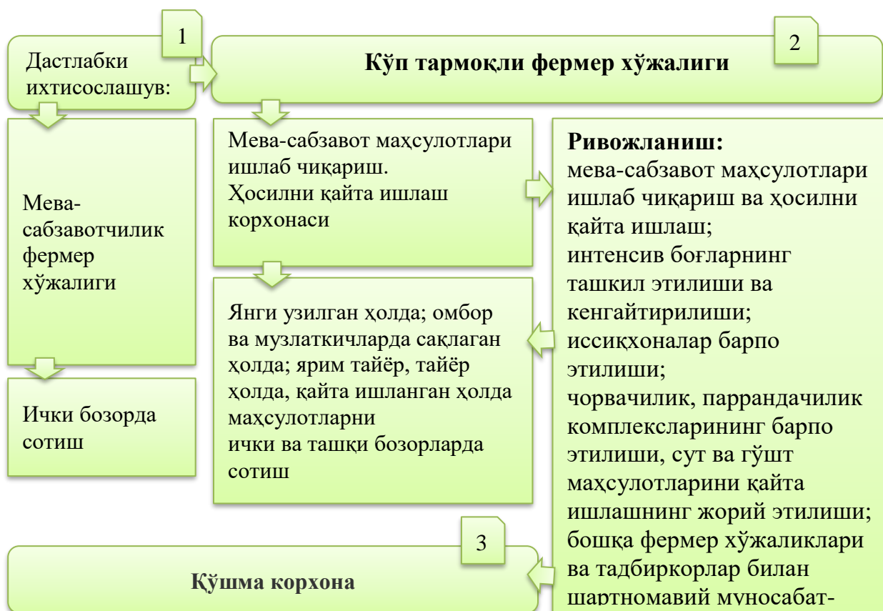
2-расм. Мева-сабзавот фермер хўжалигидан кўп тармоқли фермер хўжалигининг шаклланиш жараёни*

лари ривожлантирилиб, негизда кўп тармоқли фермер хўжаликлари юзага келмоқда (1-расм).