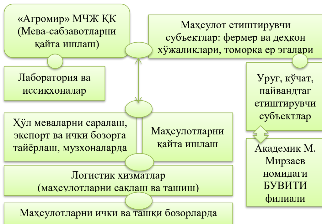
4-расм. «Агромир» МЧЖ ҚК мева-сабзавот кластерининг фаолият кўрсатиш схемаси*

• Ўзбекистон 2019 йилда $1517,5 млн долларлик озиқ-овқат маҳсулотлари экспорт қилган. Бу кўрсаткич республика умумий экспортининг 8,5 фоизини ташкил этади. Озиқ-овқат маҳсулотлари экспорти 2019 йилда 2018 йилга нисбатан 132,2 фоизга ошган. Республикада 2019 йилда $1,2 млрд долларлик 1,4 млн тонна мева-сабзавот маҳсулотлари экспорт қилинган. 2018 йилга нисбатан мос равишда 112,7 % ва 135,5 % ўсишга эришилган. Шунингдек, 2019 йилда эса 542,2 млн долларлик 816,5 минг тонна сабзавот, 658,1 млн долларлик 591,2 минг тонна мева ва резаворлар экспорт қилинган. Бу кўрсаткичларнинг 2018 йилга нисбатан ўсиши мос равишда 170,1% ва 116%ни ташкил этган.